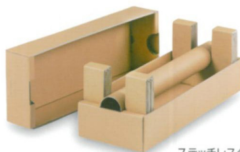
ステッチレスタイプ